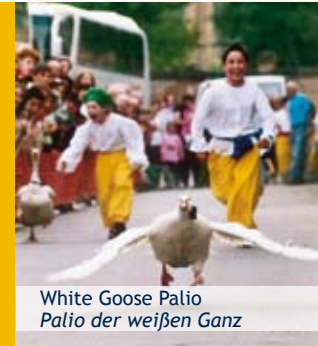
White Goose Palio Palio der weißen Ganz