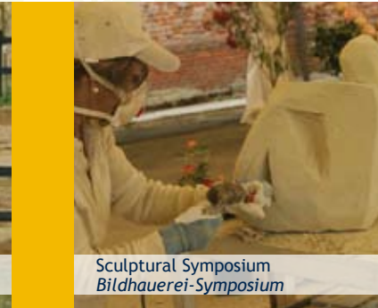
Sculptural Symposium Bildhauerei-Symposium