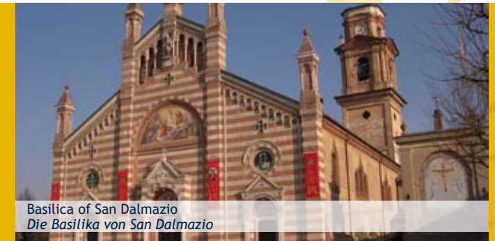
Basilica of San Dalmazio Die Basilika von San Dalmazio

Quargnento Sports Union for Amateurs - Strada per Solero, 1