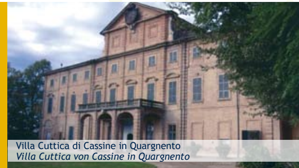
Villa Cuttica di Cassine in Quargnento Villa Cuttica von Cassine in Quargnento