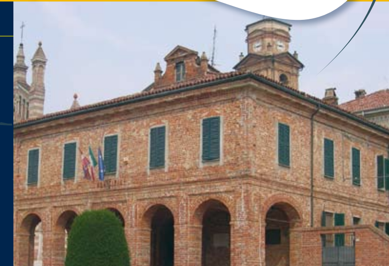
Town Hall Das Gemeindehaus

Bar und Tabakladen "Cavallo d'Oro" - Piazza I Maggio Tel +39 0131 219139