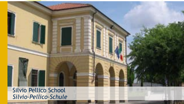
Silvio Pellico School Silvio-Pellico-Schule

Premio Letterario Gian Stefano Primo Raiteri - "Literary Prize Gian Stefano Primo Raiteri", every other year, in October